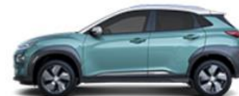
KONA Elektro, 204 PS; Navigations-Paket, Style-Paket (Audiosystem, Bluelink-Telematikdiensten, Echtleder kombiniert mit hochwertigem Kunstleder,...)